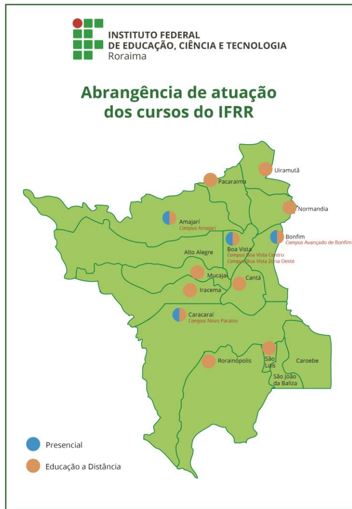
Figura 3 - Atuação do IFRR no estado de Roraima

Os cursos oferecidos pelo IFRR são definidos levando-se em consideração, dentre outros fatores, as características socioeconômicas de cada região do Estado e as demandas do setor produtivo.