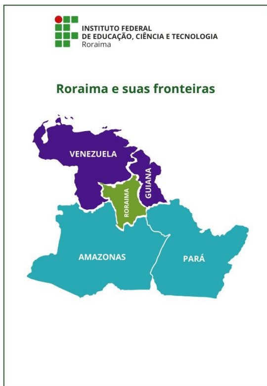
Figura 2 - Roraima e suas fronteiras

Com 224.300,8 Km 2 de área, o território roraimense é formado por 15 (quinze) municípios e possui uma população estimada em 576.568 habitantes, segundo estimativas de 2018 do Instituto Brasileiro de Geografia e Estatística (IBGE), sendo, portanto, o estado menos populoso do Brasil. O seu Índice de Desenvolvimento Humano (IDH) é de 0,707.